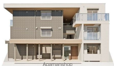
Apamanshop ※完成予想図につき、実物とは多少異なる場合があります。