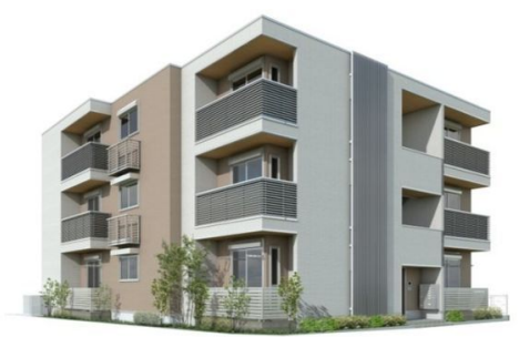
Apamanshop 完成予想図につき実際とは多少異なる場合があります。 価格は実際の状態と異なる場合があります。