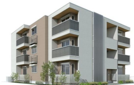
Apamanshop 完成予想図につき実際とは多少異なる場合があります。 価格は実際の状態と異なる場合があります。